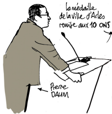
la médaille de la ville d'Arles remise aux 10 ONS

"Mes enfants ont des prénoms vietnamiens, pour qu'ils sachent d'où ils viennent."